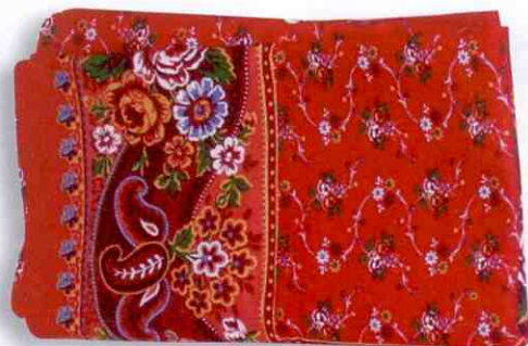
Šátek – Turčák

Na fěrtůšek neboli „brokát“ se váže stuha s podkladem bílým. Všechno musí „lícovat“. Ke kroji se váže šátek „turčák“. Obouvají se černé vysoké šněrovací boty a černé punčochy.